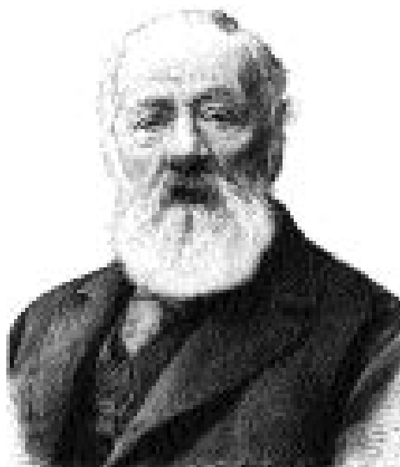
Figura 1 Antonio Meucci all'epoca del processo

scorso fino ai giorni nostri, una costante preoccupazione del Governo degli Stati Uniti [9, 10]. La chiusura consensuale del processo US/Bell, avvenuta, come vedremo, nel 1897, rappresentò soltanto la prima tappa della lunga contesa fra il Governo degli Stati Uniti e l'American Bell, culminata con la nota divestiture dell'AT&T, (American Telephone & Telegraph Co., erede dell'American Bell Telephone Co.), decretata nel 1982 e attuata nel 1984, a quasi un secolo dall'istituzione del processo qui considerato. Analoghe misure furono poi adottate in diversi Paesi europei, con l'intento di togliere gradualmente alle società telefoniche nazionali le analoghe posizioni di monopolio detenute nei singoli Paesi.