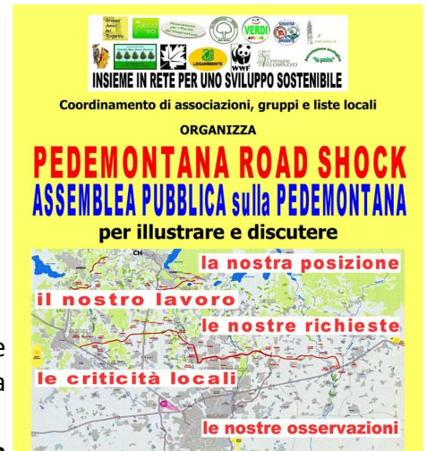
Il manifesto dell'iniziativa