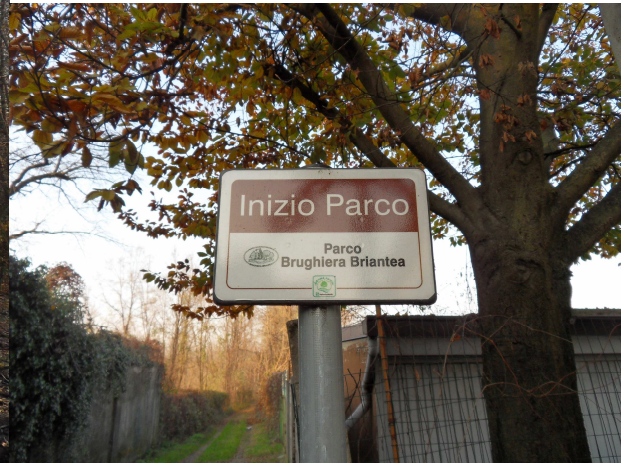
Ex cava Gallese